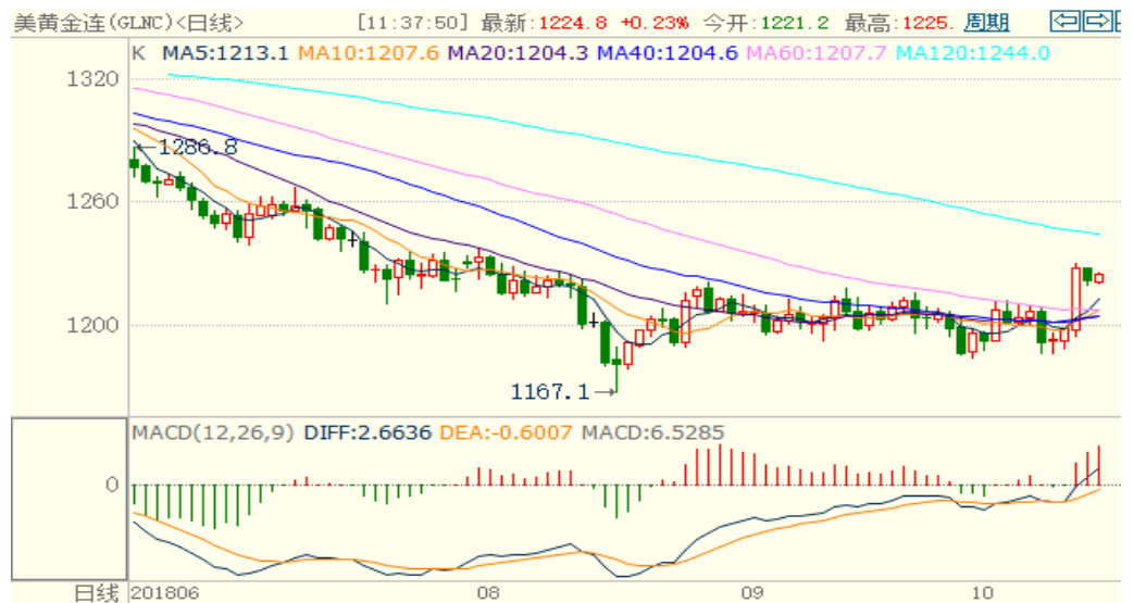
图 1：COMEX 黄金主力合约技术分析

COMEX 黄金上周下跌后上涨，目前已经突破了 1200 的震荡区间，技术指标偏多，本周可能会震荡上涨，上方目标位 1250 美元/盎司。