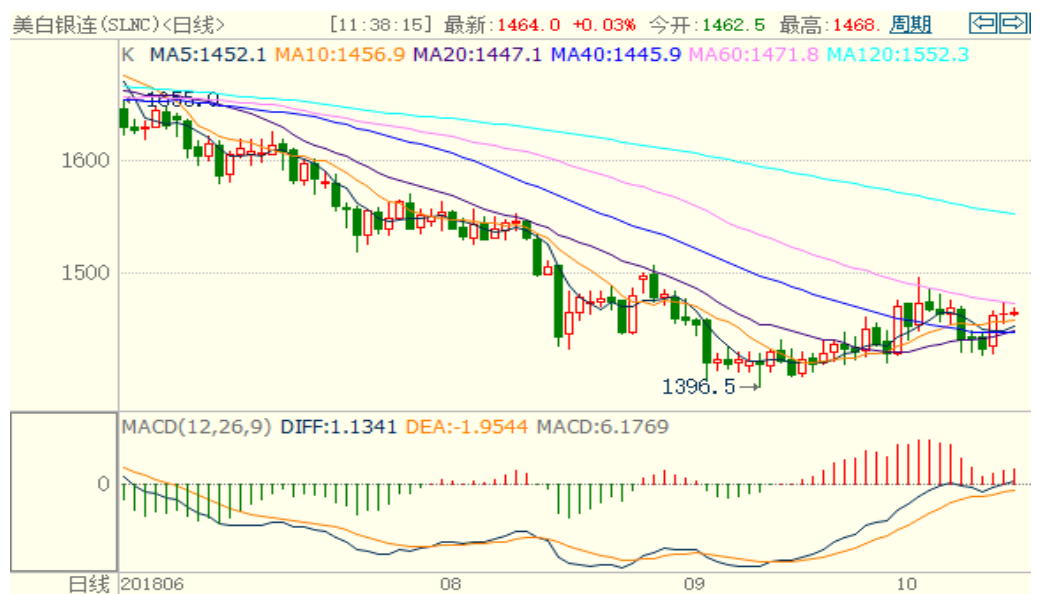
图 2：COMEX 白银主力合约技术分析

COMEX 白银上周表现较黄金更弱，下跌幅度更大上涨相对较小，技术指标偏多，预计本周或震荡上涨。